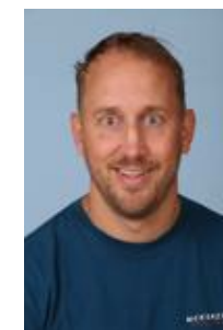
Steff v/d Meer Mdw. leerlingbalie