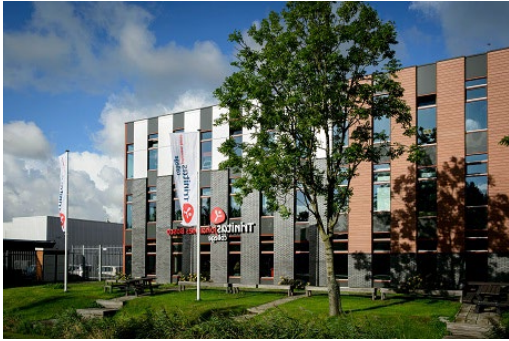
Locatie Johannes Bosco

Het Trinitas College is een katholieke school voor voortgezet onderwijs . Er zijn twee locaties : Het Han Fortmann en het Johannes Bosco. Er zijn ISK klassen ( Internationale Schakel Klas ) op het Johannes Bosco en op het Han Fortmann College