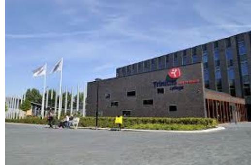
Locatie Han Fortmann