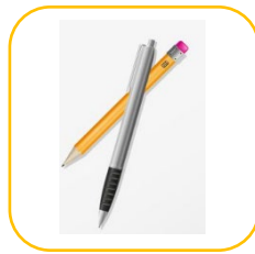
Pen en potlood