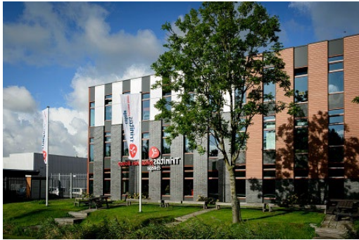
Locatie Johannes Bosco

Het Trinitas College is een katholieke school voor voortgezet onderwijs . Er zijn twee locaties : Het Han Fortmann en het Johannes Bosco. Er zijn ISK klassen ( Internationale Schakel Klas ) op het Johannes Bosco en op het Han Fortmann College